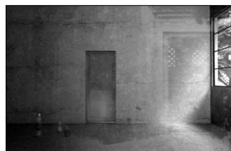
Maja Weyermann, »Recalling #1«, 2009, Rendering als Lamdaprint 64 x 100 cm, © Maja Weyermann, Berlin, 2009

Real-Time-Nomads ist ein Projekt von Maja Weyermann in Kooperation mit der Internationalen Akademie für innovative Pädagogik, Psychologie und Ökonomie (INA).