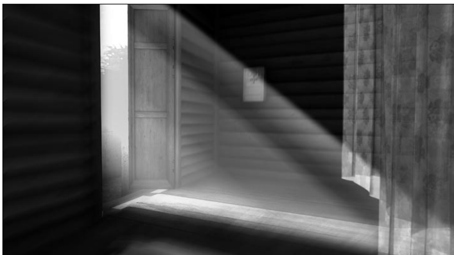
Maja Weyermann, »Bangkok #1«, 2010, Rendering als Lamdaprint 33 x 60 cm, © Maja Weyermann, Berlin, 2010

Maja Weyermann hat für ihre Arbeit zahlreiche Preise erhalten und ist in verschiedenen Sammlungen vertreten. Zuletzt waren ihre Arbeiten in der Einzelausstellung »Carnet Indien« im Le Corbusierhaus in Berlin und in der Gruppenausstellung »Zeigen, Eine Audiotour durch Berlin« von Karin Sander in der Temporären Kunsthalle Berlin zu sehen. Maja Weyermann lebt und arbeitet in Berlin.